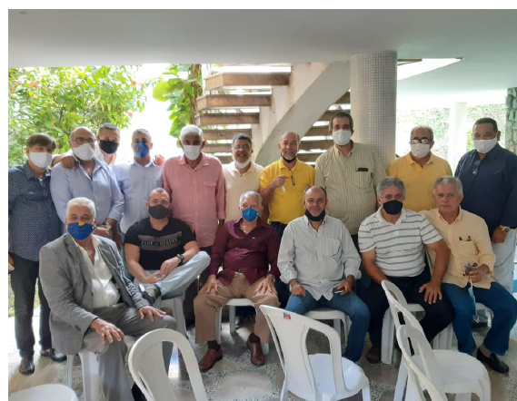
Trincheira do Bem