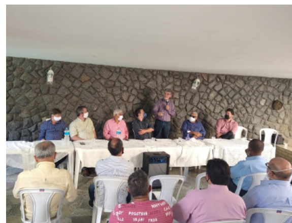
Trincheira do Bem