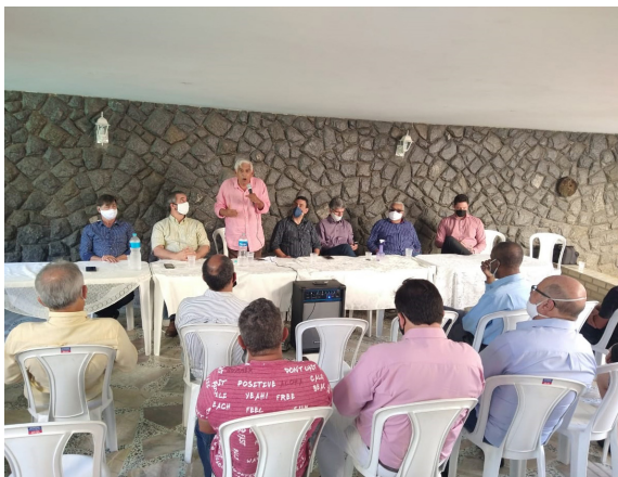
Trincheira do Bem