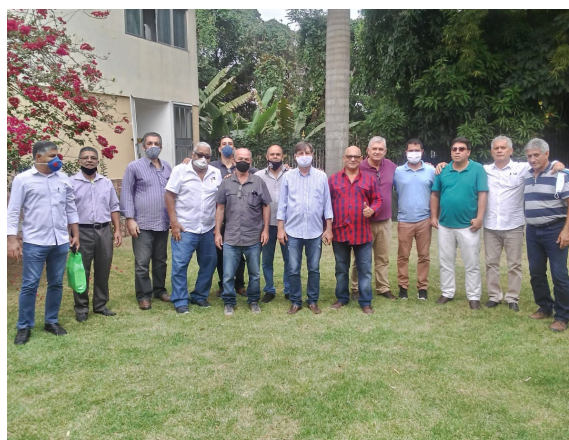
Trincheira do Bem