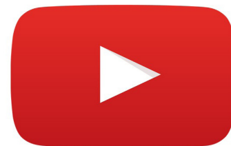
Vídeos em Destaque. Pg 11

Muitos policiais brancos, na terra do Tio Sam, tratam o homem negro como se fosse uma fera, ou como um inimigo em potencial. Ainda vou estudar esta cultura do terror onde a tortura não é só um método para arrancar informações de alguém, mas é também uma cerimônia de confirmação de superioridade e poder. Pg 03